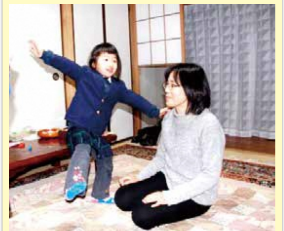
「ねえ、みてみて〜。すごいでしょ！」