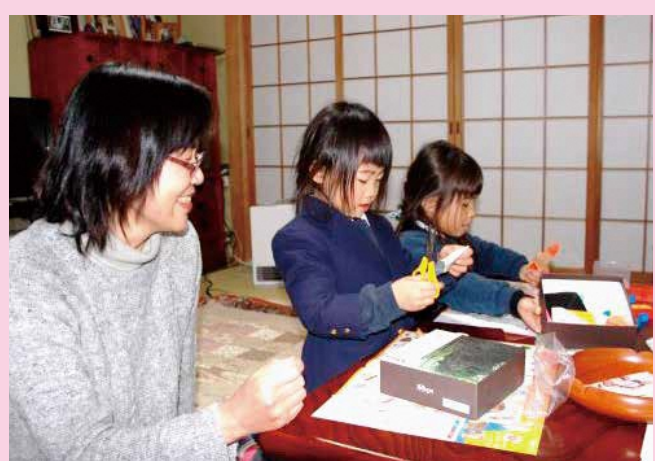
「さあ！きょうは、なにをつくろうかな」