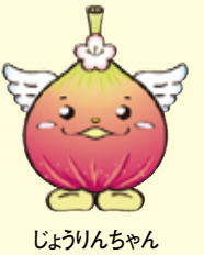
じょうりんちゃん