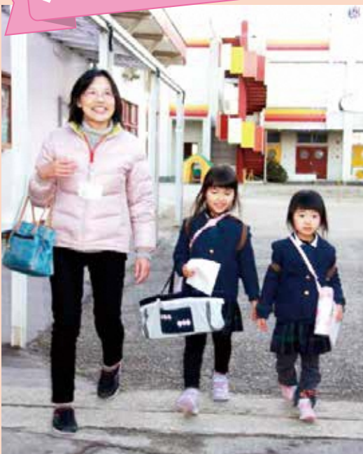
「さあ、おうちへかえろうね！」