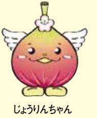
じょうりんちゃん