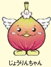
じょうりんちゃん