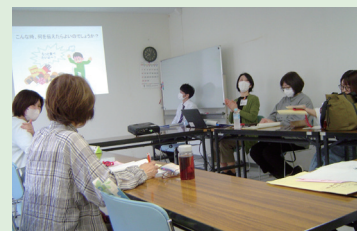
第1回(4月開催)の様子